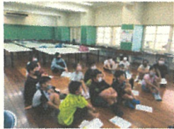
結成式（旗頭の子も達）

本校では、1年生と6年生による異学年交流を行っています。朝の準備や給食、掃除の手伝い、体力テストでのサポート等、交流活動によって年齢という枠組みを超えて、子ども達がお互いに刺激を受けながらの成長を促しています。