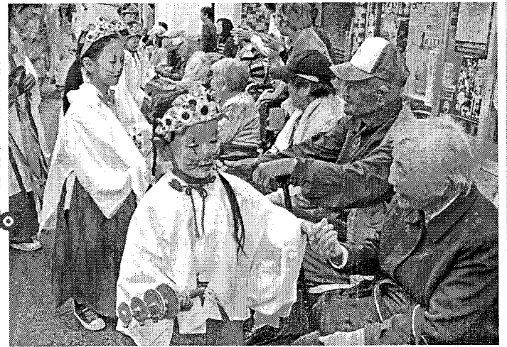
令和3年度 地域の絆 最優秀賞