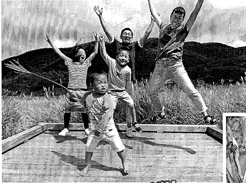
令和3年度 家族の絆 最優秀賞