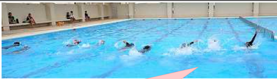
クロールや平泳ぎなど、模範泳法（もはんえいほう）を披露する6年生