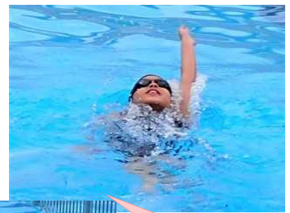
背泳ぎやバタフライを披露する子もいました