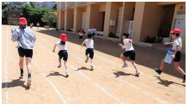
50m走の伴走（ばんそう）をする6年生

体カテストの取組の中で、高学年が低学年を思いやる場面がたくさん見られました。素晴らしいことです。6年生は1年生を、5年生は2年生を、ペアを組んで、整列させたり、やり方を教えたり、はげましたりと心をこめてお世話をしてくれました。