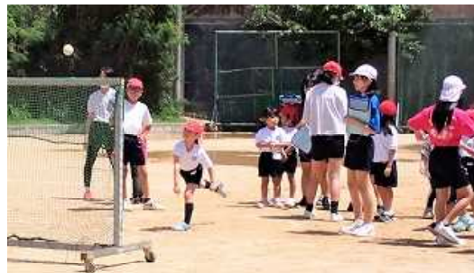
やり方もしっかり教えています