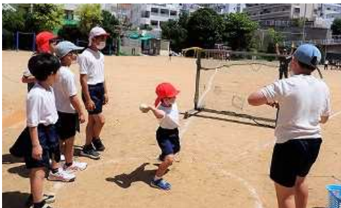
ソフトボール投げの励ましと記録