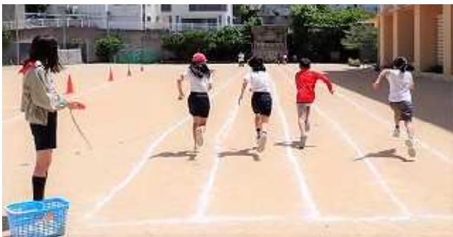
2年生へのお手本として走る5年生