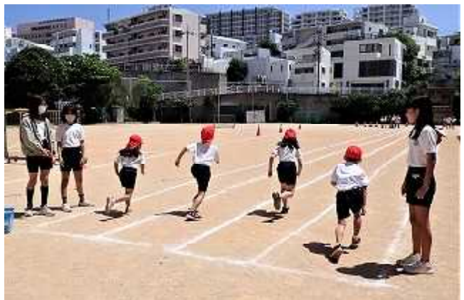
5年生をお手本に一生けんめい走る2年生