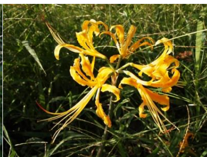
ショウキズイセン

ヒガンバナは、江戸後期から現代にかけて、多くの物語や歌にうたわれています。先に触れたように、4年生の国語の教科書には、新美南吉の『ごんぎつね』にヒガンバナの描写があります。また、上の写真のように白い品種やよく似た黄色のショウキズイセン（ヒガンバナとは別種）なども、同じ時期に開花して、秋の野をいろどります。