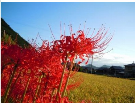
田んぼのあぜに咲くようす

9月22日は「秋分の日」で、秋の彼岸 ひがん です。ところで、皆さんは、「ヒガンバナ」という植物の花を見たことがありますか？校長先生の家で咲いたヒガンバナを持ってきたので、各学級にまわしますね。