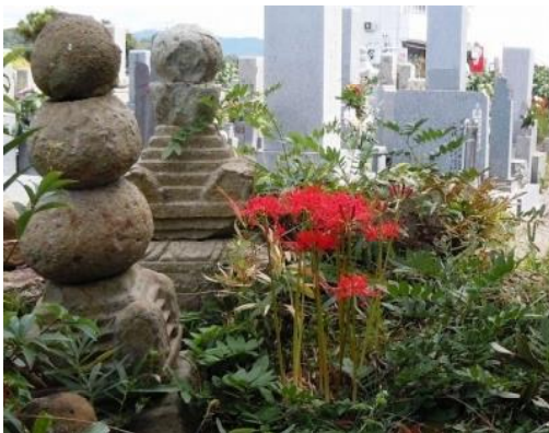
墓のそばにも多く植えられていた

一方、墓場にも多く植えられています（土葬をしていた頃）。これも、異臭や有毒性を利用して、遺体を動物から守る目的からだいらわれています。