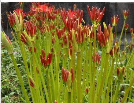
地面からつぼみが芽を出して開花