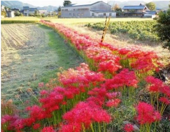
ごんぎつねが歩いてきそうな田んぼ道

さて、ヒガンバナの球根（鱗茎）には、リコリンなどのアルカロイド成分が含まれており、有毒です。この有毒性や悪臭を利用して、モグラやネズミなどの小動物から田んぼのあぜ道を守る目的で植えたとの説があります（沖縄ではあまり見かけませんが、本土の農村地域ではよく見られます）。