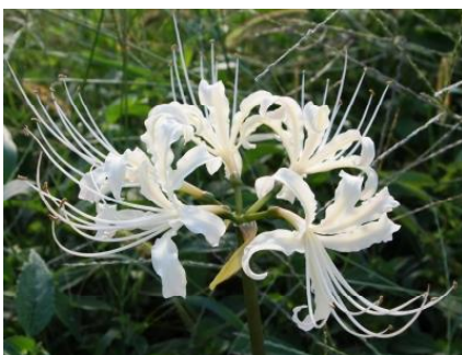
白花種のヒガンバナ

また一方では、法華経の「摩訶曼荼羅華、曼珠沙華」にある、サンスクリット（梵語）の”Manjusaka”（マンジュウシャカ）天上の赤い花」からめでたい象徴として「マンジュシャゲ（曼珠沙華）」という別名もあります。