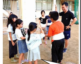
鉦子のたたき方も高学年が教えます