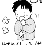
せきやくしゅみ(だ液)