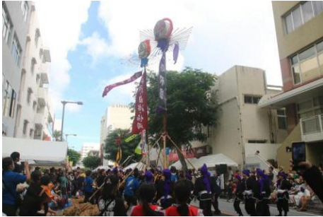
6小中学校のガーイー（一斉共演）はぶつからんばかりの大迫力