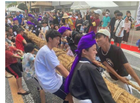
絶対に負けたくないと言ったと渾身の力で挽いた大綱 逆転勝利に大満足！