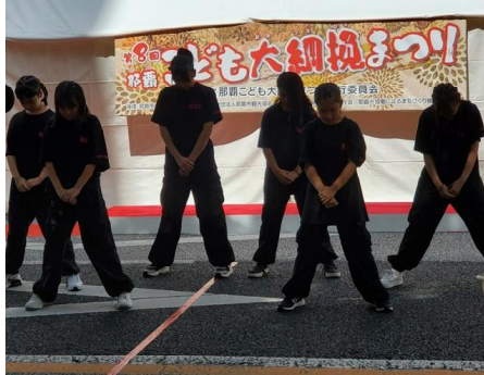
青少年舞台プログラムとダンス同好会BUZZ 会場は拍手喝采