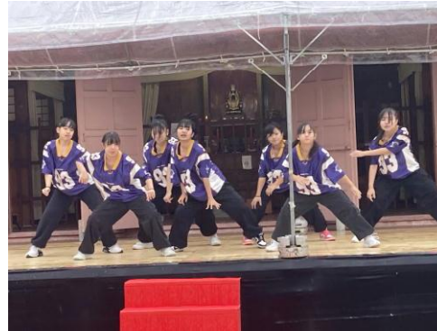
ダンス同好会BUZZの演舞