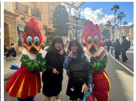
京都自主研修とUSJでの様子 日常にはない勉強と遊びで笑顔いっぱいです