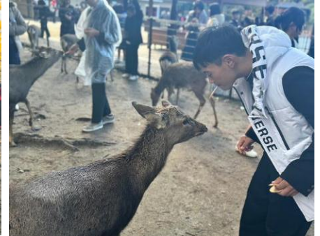
無病息災や願いが叶うといわれている「大仏殿の穴くぐり」&「奈良公園で鹿と遊ぶ」様子