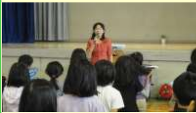
教頭先生と朝のあいさつ

11月13日(木)、児童朝会。今回は栽培委員会と放送委員会の皆さんによる集会です。はじめに、栽培委員会からのお願いと栽培している花の名前クイズがありました。三択のクイズには、おもしろい答えもあって楽しくクイズに参加していました。次に放送委員会の発表では、一日の活動について、パワーポイントで写真を見せながら説明していました。また、年齢によって聞こえたり、聞こえなかったりする音を聞かせ、聞こえたら手を挙げるゲームもあり、盛り上がりました。会場の先生方の年齢が…。栽培委員会と放送委員会の皆さん、毎日の活動と発表ありがとうございました。