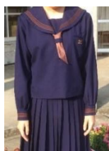
(冬服セーラー・スカートタイプ)