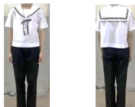
(冬服セーラー・ズボンタイプ)